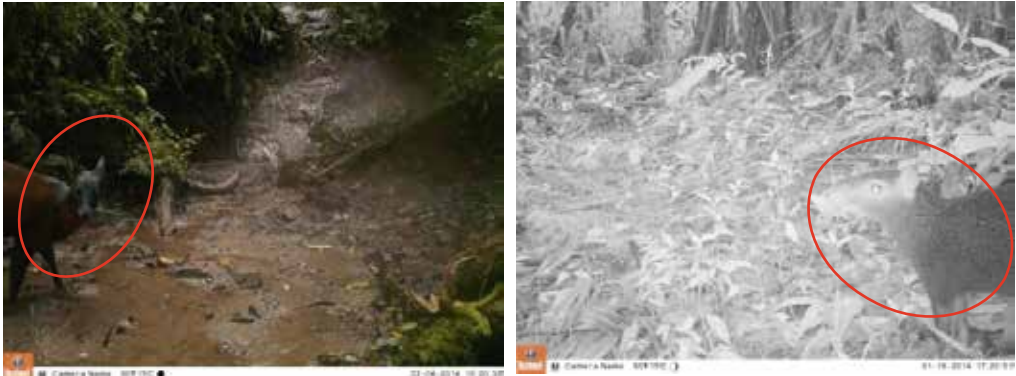
Figura 2. Fotos de las trampas-cámara en las localidades de estudio. Arriba a la izquierda ( Nasua nasua ), derecha ( Pecari tajacu ), en el medio a la izquierda ( Leopardus tigrinus ), derecha ( Tapirus pinchaque ), abajo a la izquierda ( Mazama rufina ), derecha ( Dasyprocta fuliginosa )

Se destacan los registros de tapir de montaña y su homólogo de la Amazonía ( Tapirus terrestris ), especies indicadoras de calidad de hábitat, en bosques bien conservados. El género Tapirus es considerado como el jardinero del bosque, contribuye a la dispersión de semillas, regulación del crecimiento de algunas plantas y mantiene los suelos fértiles; los registros se localizan en las zonas más alejadas pero todavía de alguna influencia de la comunidad, por lo que se trata de una especie amenazada en este sector, cuya viabilidad a largo plazo depende de los planes y programas que se puedan implementar para precautelar la conservación de ésta y otras especies indicadoras de ecosistemas saludables.